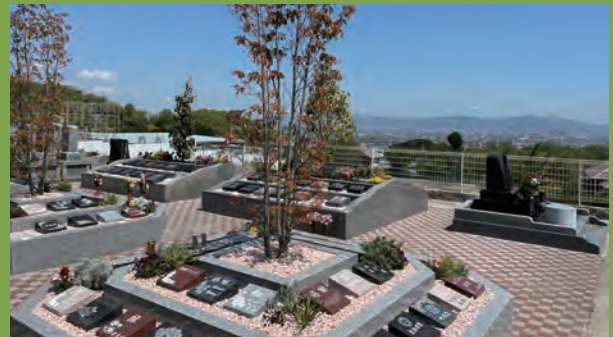
浄願寺 葛城市寺口1170