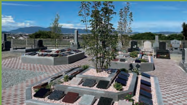
念佛寺 天理市中山町401