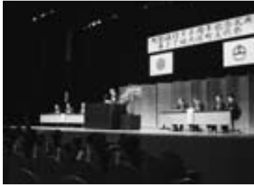
◀式典の様子 厳肅な雰囲気の中、未来の大淀町に向けて祝辞が述べられました。

本年度は大淀町が町制を施行して90周年の節目にあたります。初日の3日は、町制施行90周年記念式典が挙行され、あわせて本文化祭の開会セレモニーが行われました。式典では、公募により選ばれた町マスコットキャラクター「よどりちゃん」のお披露目を兼ねたイベントが行われました。