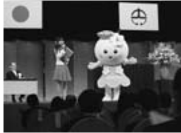
◀町マスコットキャラクターの披露 生まれたばかりの「よどりちゃん」。

午後からの「芸能発表会」では、出演者が舞台の上で日頃の練習成果を精一杯披露し、例年通りの盛り上がりを見せました。