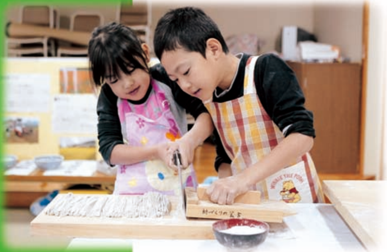
仲良く蕎麦作りに挑戦!