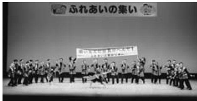
▲元気いっぱいのソーラン節

会場では、有志らによるソーラン節やフラダンス、合唱などが披露され、参加者は楽しいひとときを過ごしました。