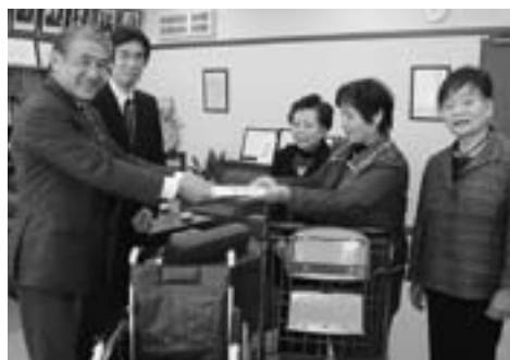
◀町商工会女性部のみなさん