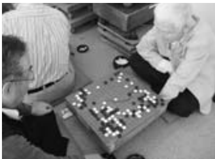
▲囲碁・将棋大会 真剣勝負! 勝つのはどっち?

4日は、あらかしホールで恒例の「カラオケ大会」が、町中央公民館では「囲碁・将棋大会」が行われました。