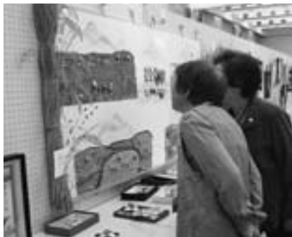
▲町展 細やかな作品に感心しながら…。