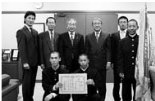
▲大淀中学校 野球部のみなさん

11月14日(月)に行われた町への優勝報告では、町長からの「練習で泣いて、試合で笑う。普段の厳しい練習で培った力を出して、近畿大会でも勝ち進んでください！」との激励の言葉がありました。