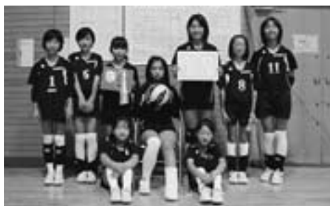
◀優勝した緑ヶ丘スポーツ少年団Aチーム

【大会結果】 優勝 緑ヶ丘スポーツ少年団Aチーム 準優勝 中西増スポーツ少年団 第3位 北野スポーツ少年団