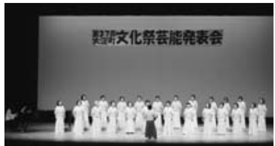
▲芸能発表会 日ごろの練習成果を精一杯発揮しました。

その他にも、3日に「お茶席」、来年の干支「辰」を作る「折り紙・切り絵講習会」が行われ、3・4日の両日にわたって、町民のみなさんによる「作品展示(町展)」、町食推協(食生活改善推進員協議会)展示、歴史展示「古代の今木 再発見!」、DVD「大淀町歴史探訪」の上映などがあり、また、昨年の文化祭や町文化連盟の活動を紹介する展示が行われました。