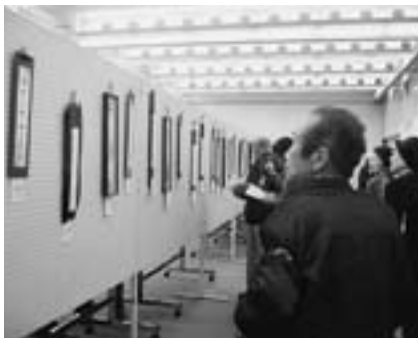
▲町展 上手い!と思わせる、どれも力作ぞろい。