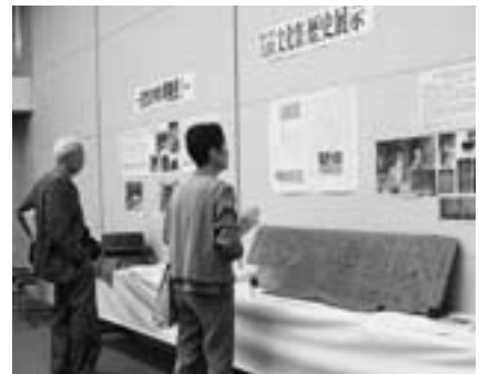
▲歴史展示 今木地域に伝わる歴史と文化を紹介。